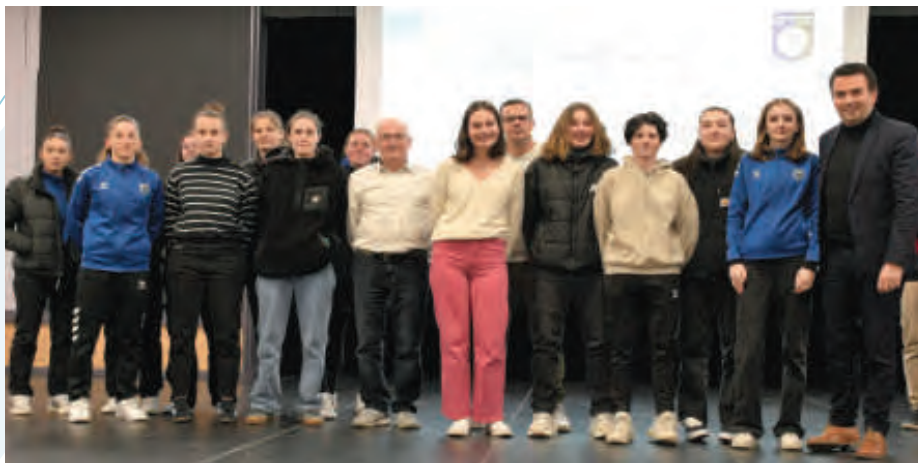
Les joueuses U18 du club de foot (MJBF) récompensées à l'occasion de la réception des sportifs du vendredi 19 janvier 2024 en présence du maire Benoît Cochet, des élus Daniel Neau et Christophe Pasquier.

appliqués dans nos associations se transmettront dans nos foyers pour accélérer le changement de nos habitudes.