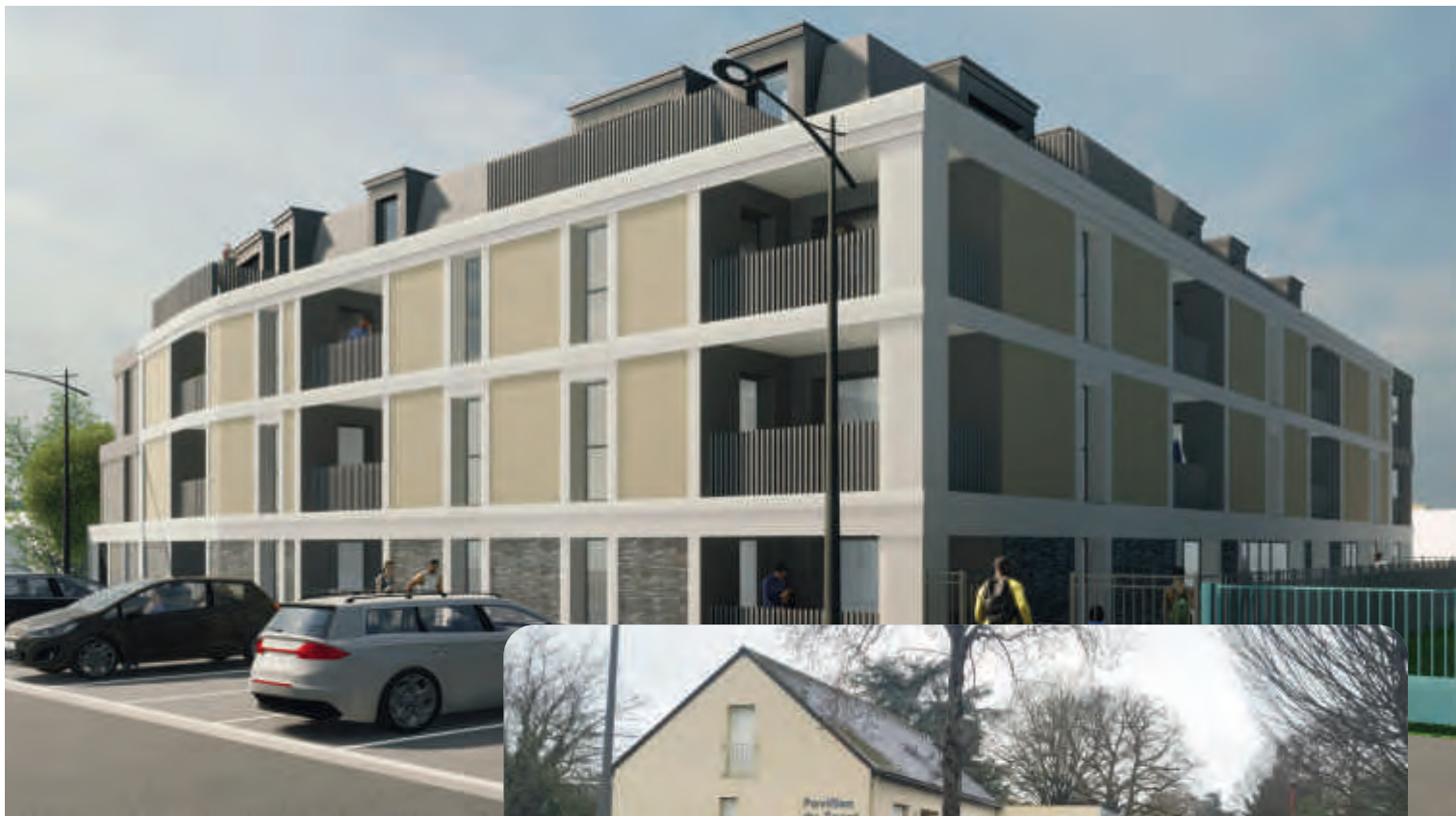
Ci-contre une vue du Pavillon des sports fin 2023. En haut de page, la vue d'architecte du Pavillon projetée à l'horizon 2026 (crédits : HB Architectures, Aurélien Hubert).