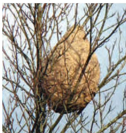
Nid de frelons asiatiques

Le service espaces verts communal s'occupe des destructions de nids de frelons asiatiques sur l'espace public. En 2023, il a détruit 17 nids.