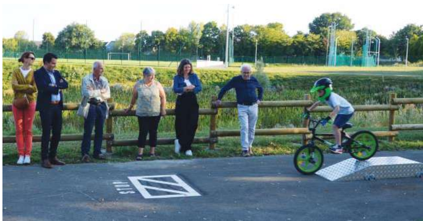
Inauguration de la piste d'apprentissage vélo, près du skatepark en septembre dernier