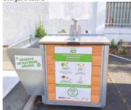
La nouvelle borne d'apports collectifs de biodéchets rue Georges Brassens

Trois points d'apports collectifs de biodéchets sont en cours de déploiement en ce début d'été dans les secteurs Bazin, Espéranto et Marco Polo.