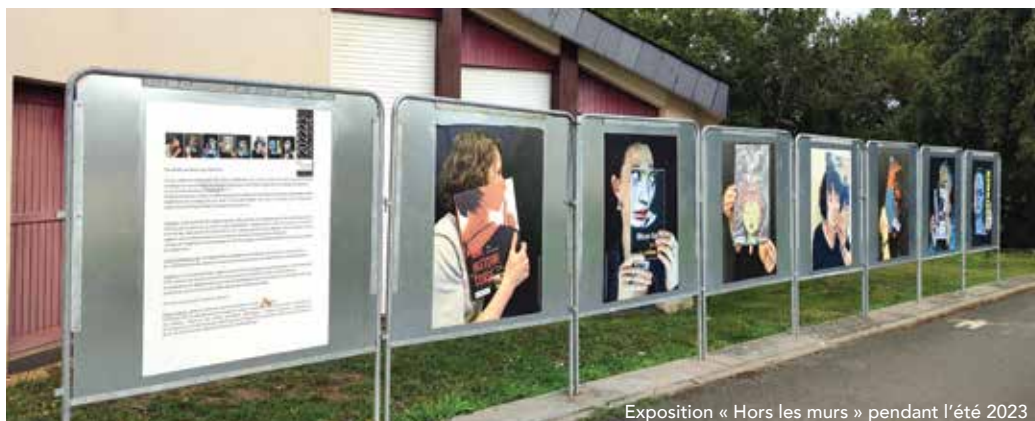
Exposition « Hors les murs » pendant l'été 2023