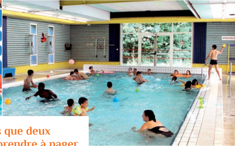
Jeux et détente lors de la fête de l'été en juillet.

La piscine Camille Muffat, ce n'est pas que deux bassins. C'est d'abord un lieu pour apprendre à nager et rester en forme pour les Montreuillais(e)s et les habitants des communes avoisinantes. Zoom sur une saison riche en activités et en apprentissages.