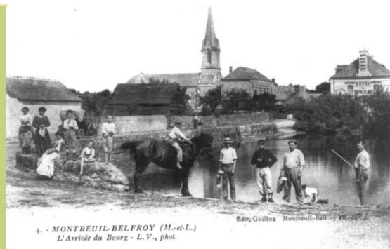
4. - MONTREUIL-BELFROY (M.-d.-L.) L'Arrivée du Bourg - L.V., phot.