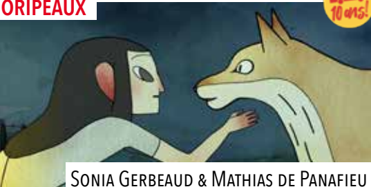
SONIA GERBEAUD & MATHIAS DE PANAFIEU

Dans un village isolé, une petite fille a pris l'habitude de nourrir des coyotes. Ce rituel est la seule chose qui l'intéresse dans une vie qui lui semble ennuyeuse. Mais les hommes s'en aperçoivent vite et mettent violemment un terme à cette relation, sans se douter du soulèvement qui les guette.