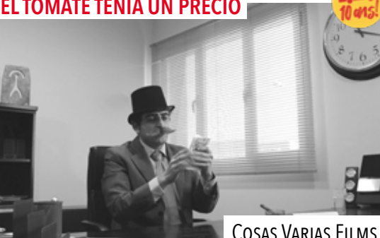
COSAS VARIAS FILMS

L'agriculture : un métier difficile qui n'est pas récompensé à sa juste valeur !