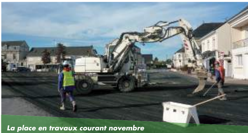
La place en travaux courant novembre

Après près de deux mois de chantier, les travaux de la place de la République s'achèvent. Pour les fêtes de fin d'année, les usagers vont pouvoir à nouveau se stationner au plus près des commerces afin de faire leurs achats de Noël et