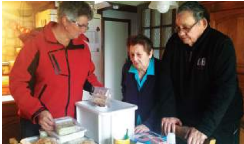
Portage de repas à domicile organisé par la ville

Dans ce domaine, l'action municipale s'inscrit dans une réflexion nationale qui donne lieu actuellement à la préparation d'un projet de loi sur l'adaptation de