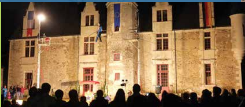
Samedi 12 mai : Lâcher de pigeons avec les délégations franco-allemandes, soirée festive au parc de la Guyonnière