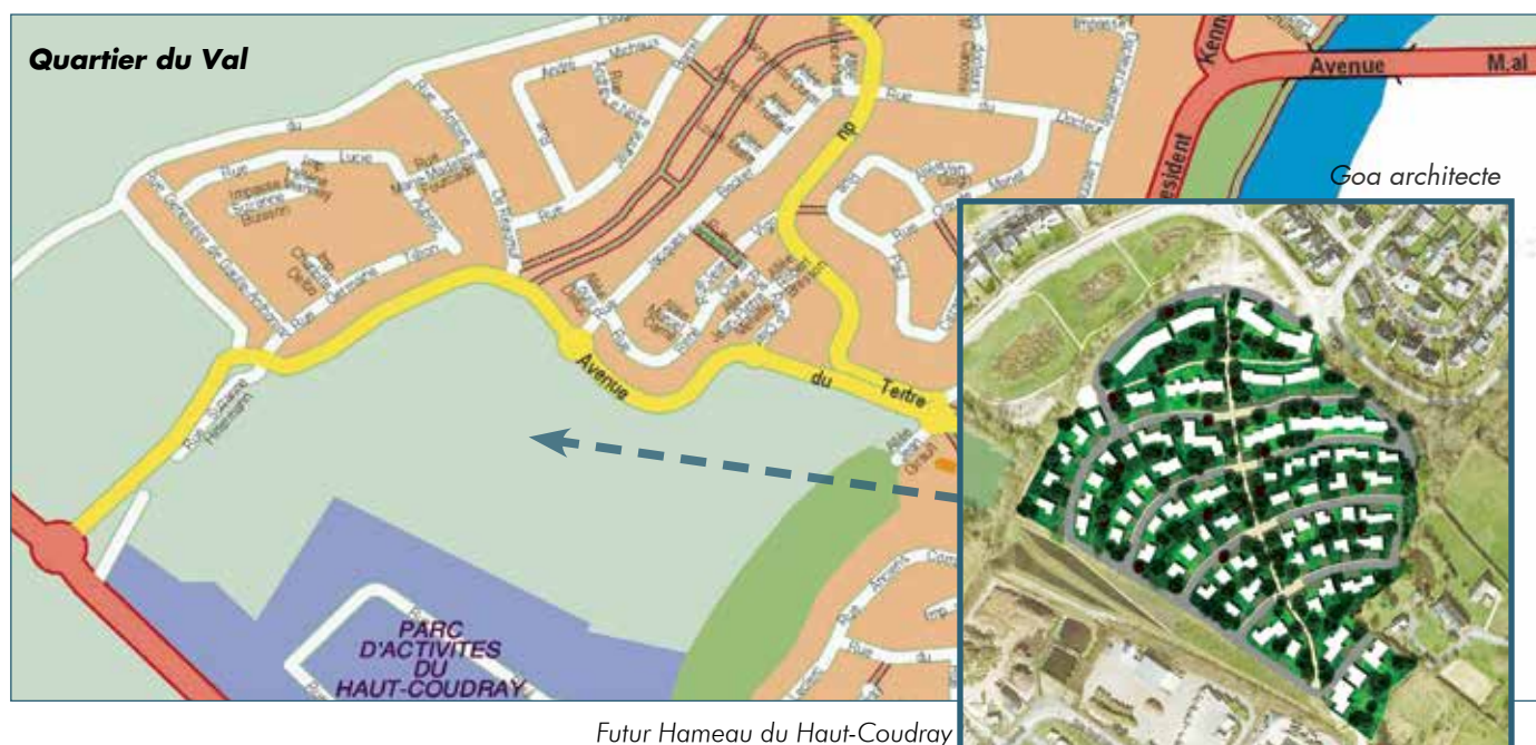
Futur Hameau du Haut-Coudray

Pratique : Inscriptions à la Mairie sur liste d'attente. Pour tout renseignement, contacter l'agence commerciale d'Alter, au 02 41 270 270.