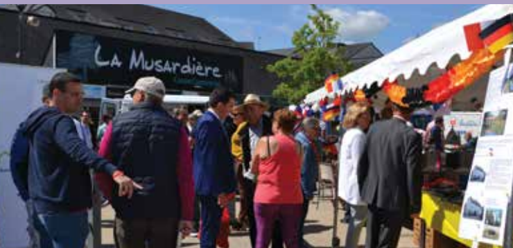
Vendredi 11 mai : marché avec stands franco-allemands, olympiades sportives et ludiques au complexe sportif