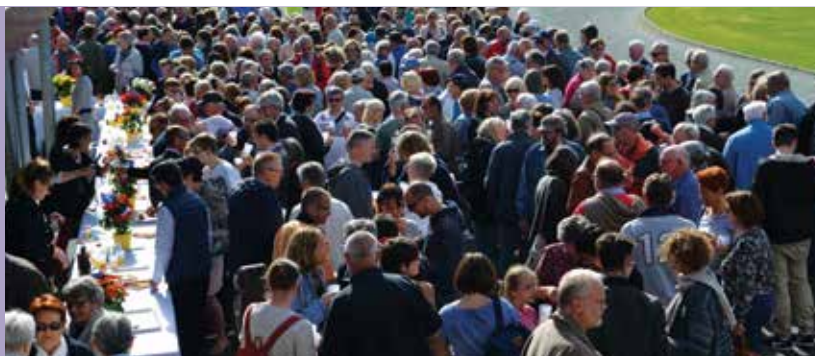
Jeudi 10 mai : arrivée des Kamenois au stade Conotte