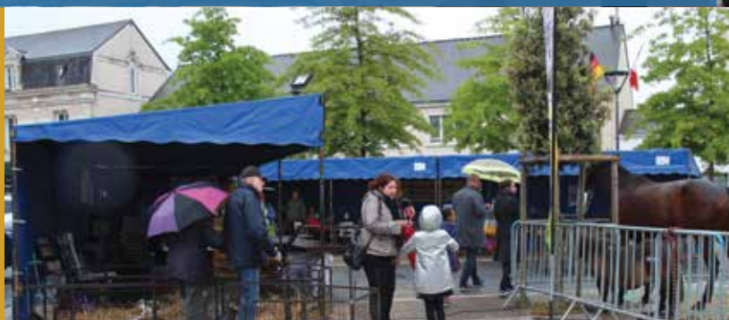
Vendredi 11 mai : soirée musicale à la salle J. Brel - Samedi 12 mai : Nature en fête, place de la république