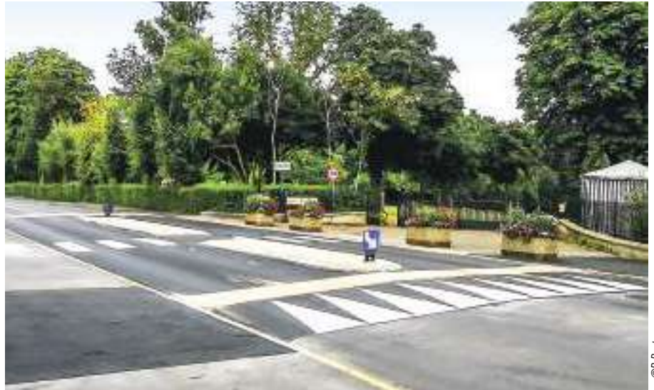
Plateau sécurisé à l'entrée du parc F. Mitterrand

«La municipalité porte une grande attention à la sécurité», avance Jacques Renaud, adjoint chargé des travaux. Dans les faits, cette volonté se traduit par l'aménagement d'axes et de lieux de fréquentation stratégiques. Ces adaptations prennent en compte un certain nombre de paramètres, dont la densité du trafic, la vitesse des véhicules ou encore la cohabitation des différents usagers de l'espace public. Sur la base de ces critères, les services techniques municipaux et