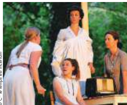
© C ie le temps est incertain

« La vieille fille » d'après H. de Balzac, C ie Le temps est incertain mais on joue quand même, lundi 8 juillet, 21h , théâtre de verdure (près de la mairie).