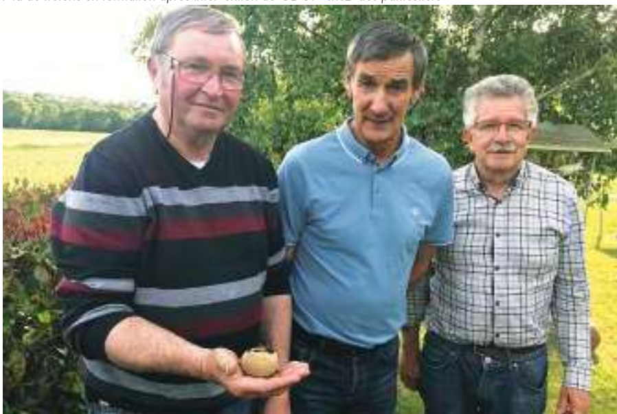
Nid de frelons en formation après intervention du GDON chez des particuliers