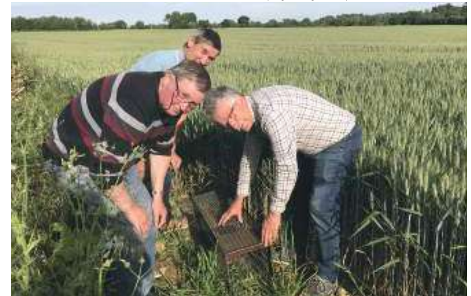
Installation d'un piège à ragondins par des membres du GDON

Le frelon asiatique qui décime les abeilles ; les chenilles processionnaires urticantes qui infestent les arbres ; les ragondins qui pullulent au cœur du marais, venus d'Amérique du sud et vecteurs de la leptospirose ; le renard porteur de la gale, qui se répand jusque dans le centre de Montreuil-Juigné ; le xénope lisse, amphibien invasif et mastoc originaire d'Amérique du sud, introduit accidentellement dans le milieu naturel par des aquariophiles. La liste est longue de ces espèces importées d'autres