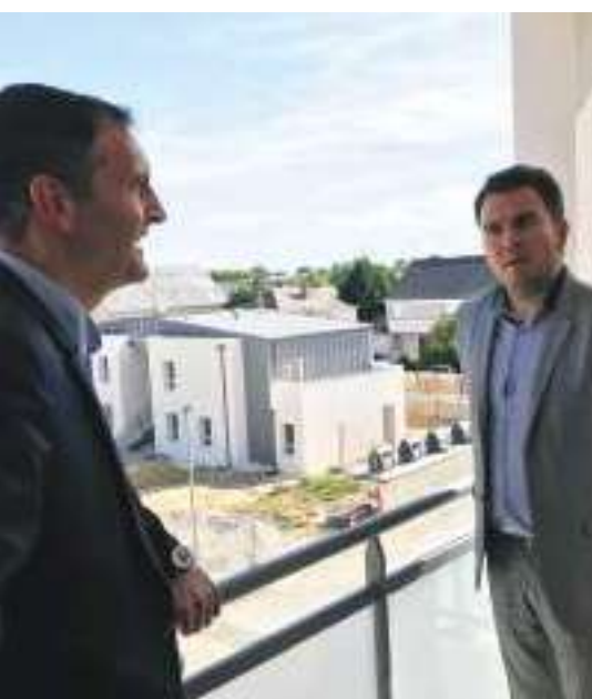
Visite de chantier fin mai avec notamment le Directeur de Podeliha et le Maire