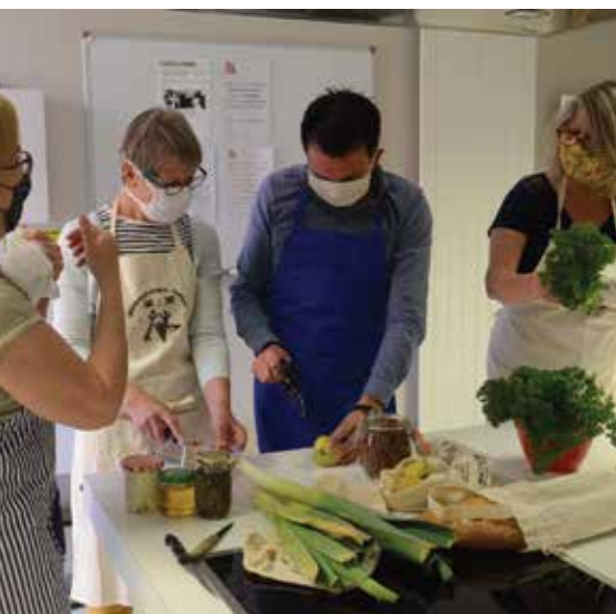
«On line Diner» organisé avec Kamen en visio, en mai dernier.

Deux distinctions européennes pour notre ville jumelle