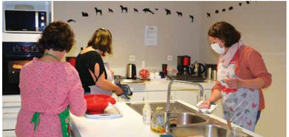
Atelier cuisine avec des Montreuillais à l'Espace solidarité

Il en ressort que l'espace Nelson Mandela, abritant à la fois le centre social et le centre communal d'action sociale, continue à être principalement perçu comme un lieu dédié aux solidarités et non à l'animation globale de la ville. « Depuis 2016, nous essayons de rendre ce rôle plus clair et plus visible. Nous avons déjà fait du chemin, mais nous devons continuer dans ce sens afin que le centre soit identifié comme un lieu pour tous. Cela passera sans doute par un futur changement de nom et par une meilleure prise en compte des besoins