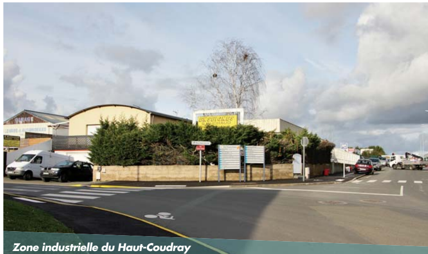
Zone industrielle du Haut-Coudray

Les commerces, eux, particulièrement dynamiques avant la crise, s'ils n'ont pas eu à fermer leurs portes, ont dû s'adapter au contexte. « La municipalité a servi de relais auprès de la Chambre