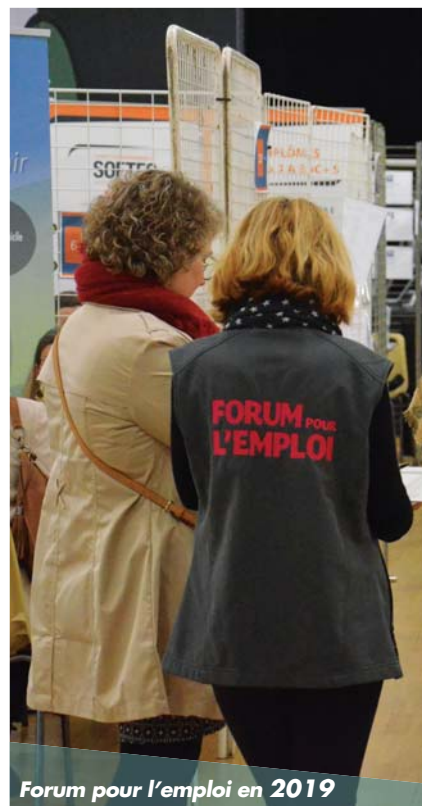
Forum pour l'emploi en 2019